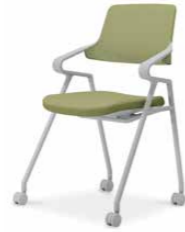
ライトグレーシェル K22-G12CW-E2V3V1 ¥64,000