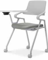
ライトグレーシェル メモ台付き K22-G21CW-E2E3X1 ¥84,000