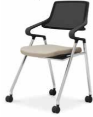
ブラックシェル K22-M13CW-BKM1E1 ¥77,000