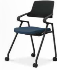
ブラックシェル K22-B11CW-BKT7X1 ¥54,000