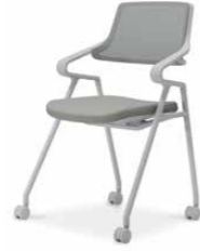
ライトグレーシェル K22-G13CW-E2E3E1 ¥65,000