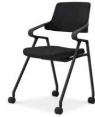
ブラックシェル K22-B12CW-BK6E61 ¥64,000