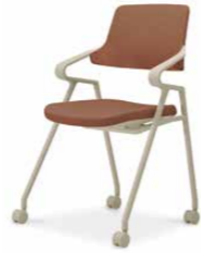
ホワイトブラウンシェル K22-Z12CW-M1461 ¥64,000