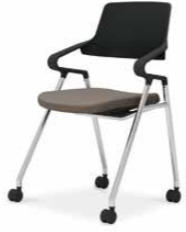
ブラックシェル K22-M11CW-BKM6X1 ¥66,000