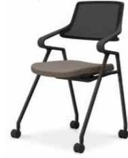
ブラックシェル K22-B13CW-BKM6E1 ¥65,000