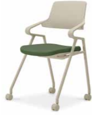
ホワイトブラウンシェル K22-Z11CW-M106X1 ¥54,000