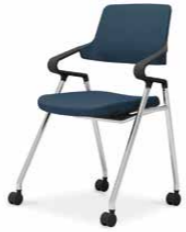
ブラックシェル K22-M12CW-BKT7T1 ¥76,000